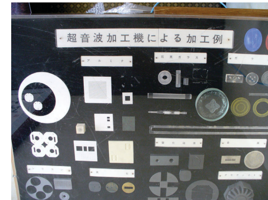
超音波加工機による加工例1